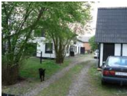
Smidstrupvej nr. 31

gyndelsen af 1930erne. Senere var her hønseri og et murerfirma.