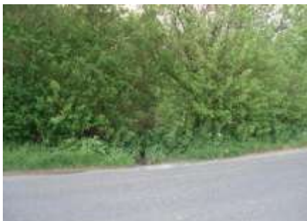
Det gamle gadekær i Smidstrup i tørvejr

Det var noget af et kratluskeri at finde den. De første huse på Smid- strupvej, som hører til Jungshoved sogn, er nr. 22 og nr. 27. Mellem hus nr. 27 og nr. 29 findes stadig resterne af byens gadekær, som blev sløjfet sidst i 30erne.