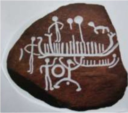
1. Opmalet helleristning

En helleristning er et tegn eller et billede, der er blevet indhugget i en