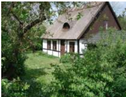
Sadelmagerhuset i Stenstrup

Ved byens gadekær i det lille strå-tækte hus, der nu i daglig tale kaldes ”feriehuset”, var der indtil en-