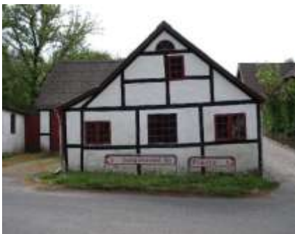
Smedjen i Stenstrup