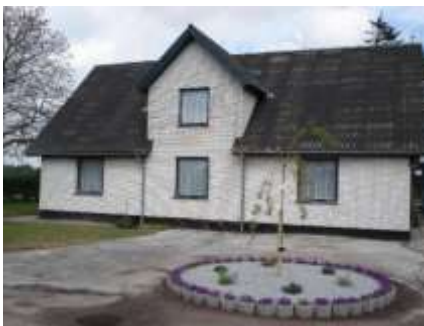
Smidstrupvej nr. 51

retning fra engang i 30'erne til op i 60'erne.