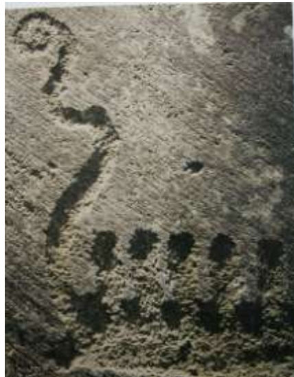
2. Helleristning med sidelys

Det er nu, der er brug for din hjælp med at finde nye stenbilleder. Så se på de sten, du møder i din have, i stenbunker, og når du færdes i naturen. Hvis du finder noget af inte-