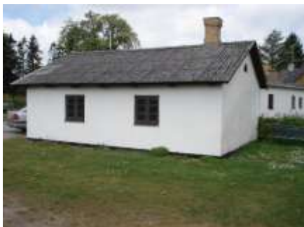
Smidstrupvej nr. 39 – den gamle smedje