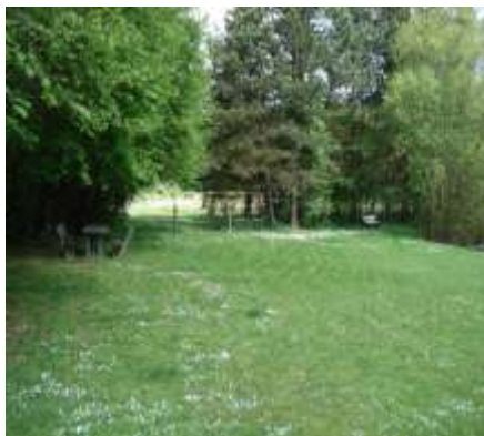
Her var sprøjtehuset ved Stenstrup gadekær